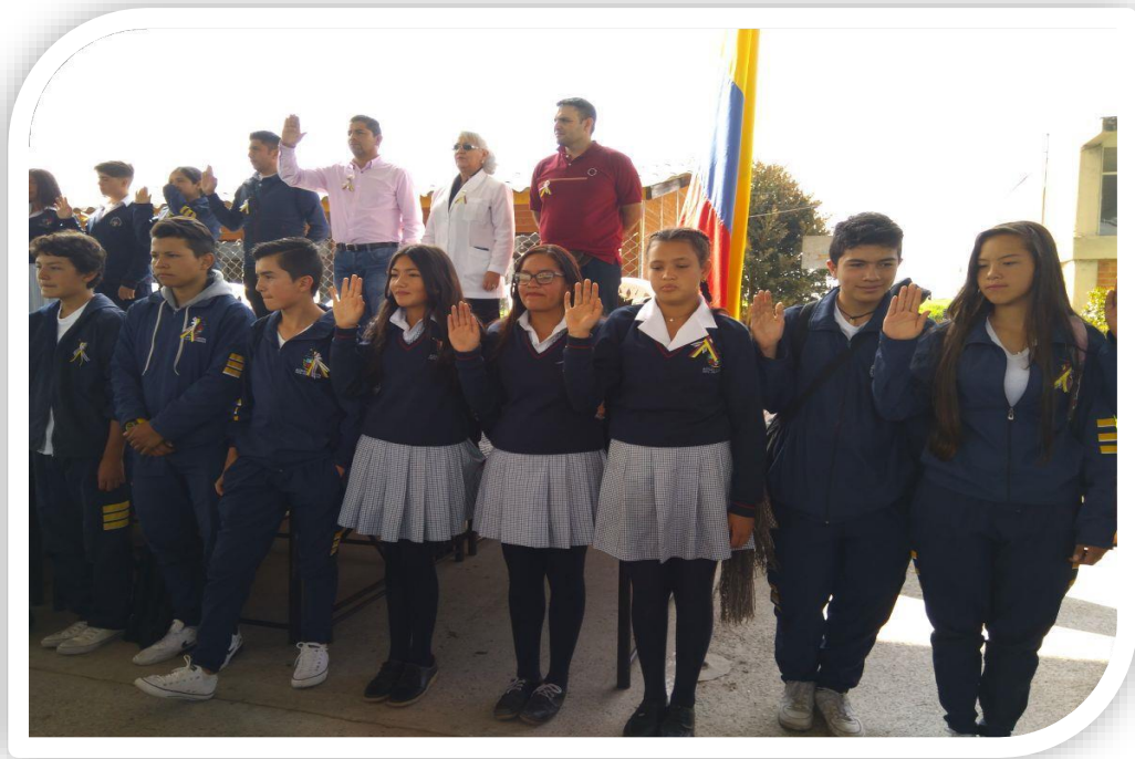
Posesión del gobierno escolar 1 de marzo de 2018