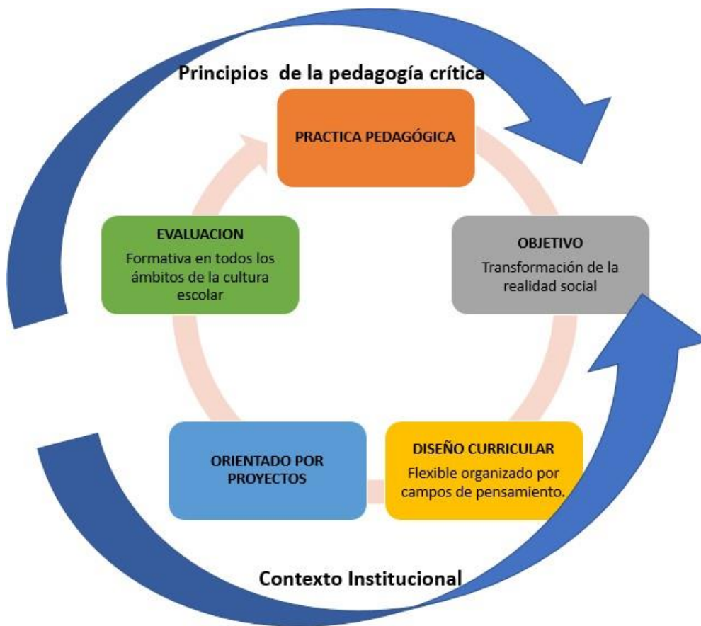
Figura 1. Propuesta pedagógica institucional.

En el centro de la acción pedagógica institucional se encuentran las prácticas pedagógicas porque es a través de la interacción en el marco de esta mediación que se logra la transformación social y el empoderamiento tanto de docentes como de estudiantes, quienes mantendrán un diálogo bidireccional, que conducirá finalmente a la transformación de la realidad social.